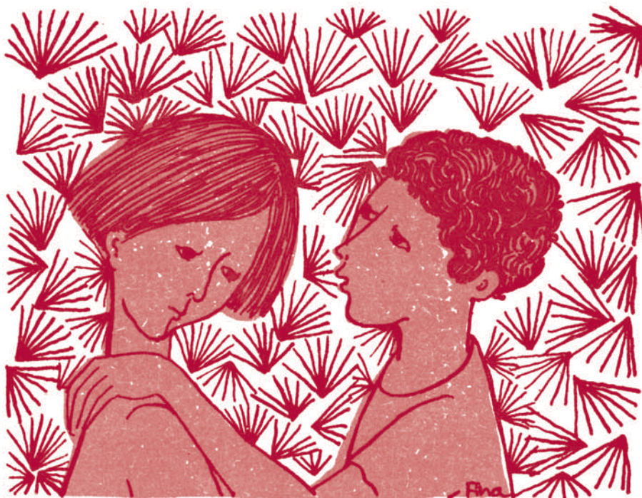
Il·lustració: Fina Rifà

Hem parlat d'il·lustradors. Caldria parlar també de dibuixants de còmic i de ninotaires? Evidentment, no hi ha fronteres precises. Però s'imposen algunes evidències. Així, constatem