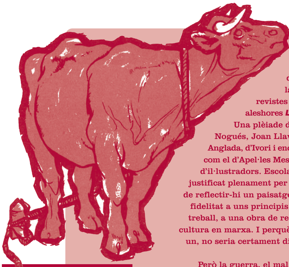
Il·lustració: Lluçia Navarro