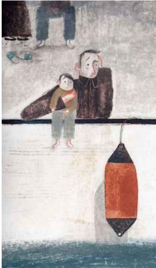
Fragment d'una de les il·lustracions de © Laia Domènech per a l'àlbum «Cues de somnis» de Rita Sineiro / Editorial Akiara Books